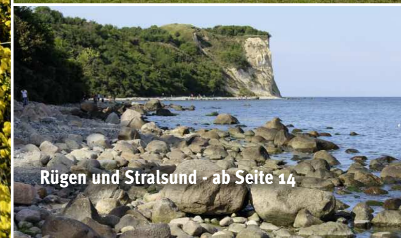
Rügen und Stralsund - ab Seite 14

IMPRESSUM: Fendt-Caravan NEWS ist das Kundenmagazin für Fendt-Caravaner. Verantwortlich für den Inhalt: Fendt-Caravan GmbH, Gewerbepark Ost 26, D-86690 Mertingen · Konzept und Erstellung: www.sewald.com · Druck: Gotteswinter und Aumaier GmbH, München.