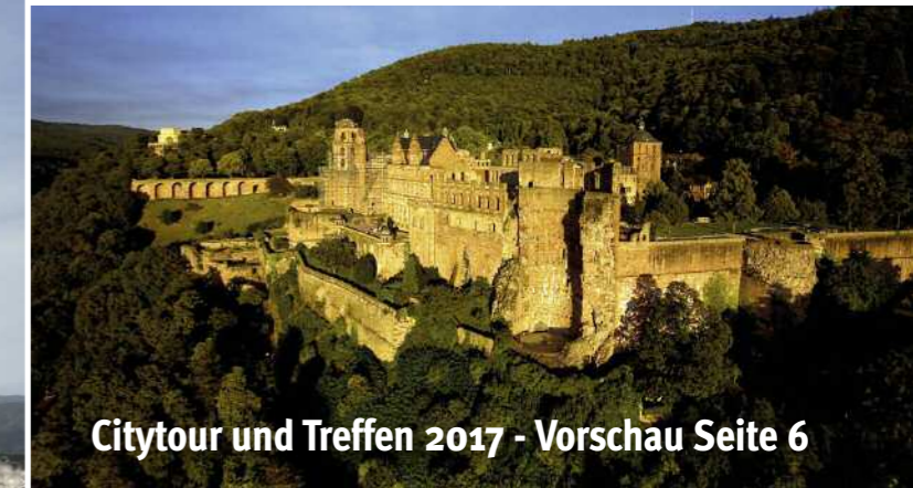
Citytour und Treffen 2017 - Vorschau Seite 6