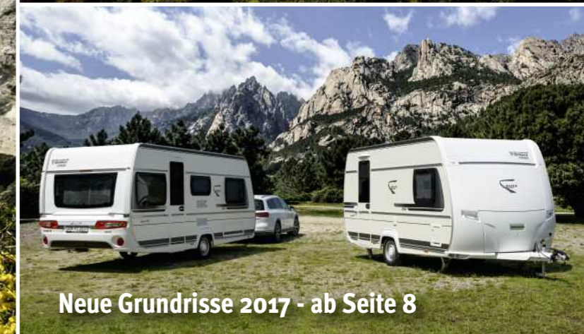
Neue Grundrisse 2017 - ab Seite 8