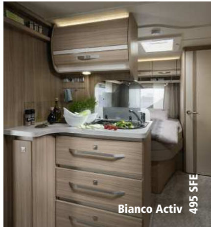
Bianco Activ 495 SFE