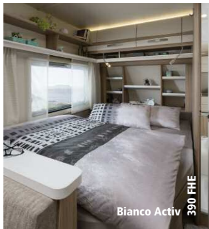
Bianco Activ 390 FHE