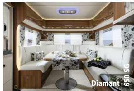
Diamant 650 SG