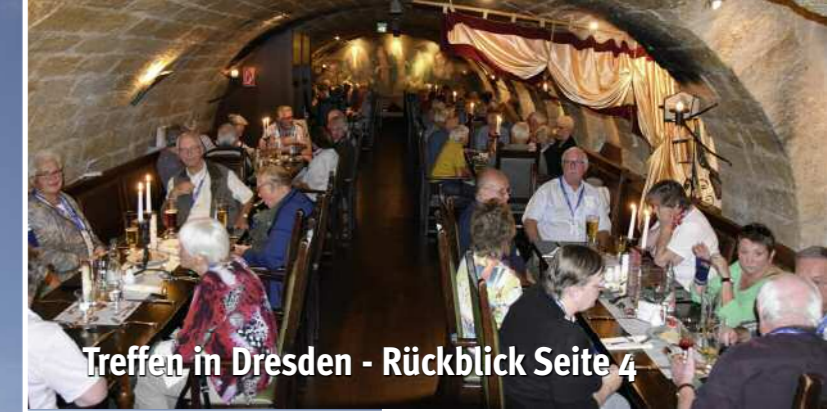
Treffen in Dresden - Rückblick Seite 4